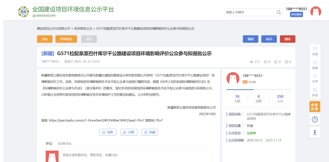
图 6-1 拟报批稿公示截图

2025年10月31日在全国建设项目环境信息公示平台（ https://www.eiacloud.com/gs/detail/1?id=509050crpC ）刊登了项目报批前公众参与信息，载体选择符合《环境影响评价公众参与办法》（生态环境部令第4号）要求。网络公示截图见下图6-1：