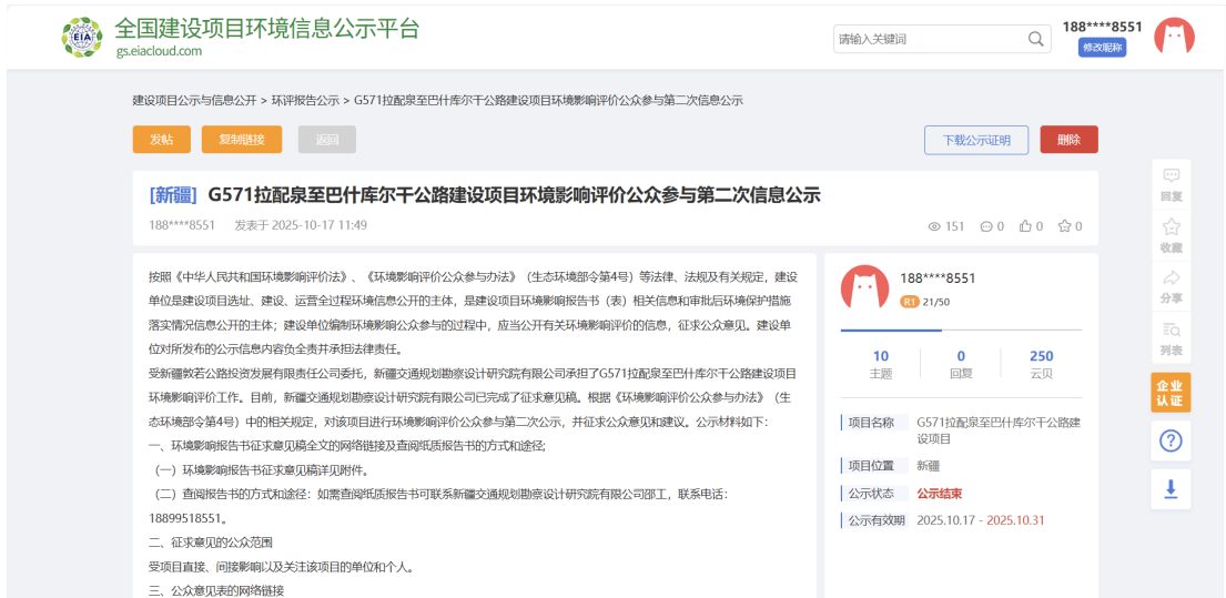
图 3-1 征求意见稿公示截图